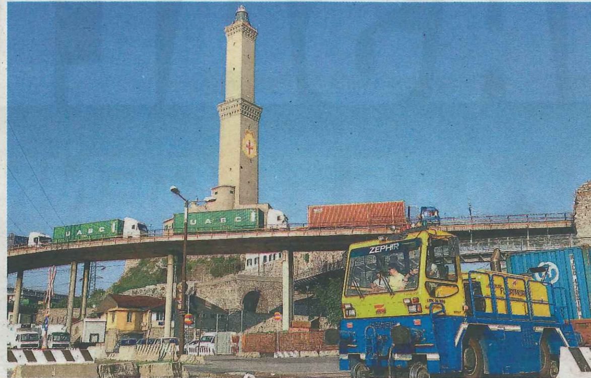
Uno dei mezzi di FuoriMuro durante uno spostamento all'interno del porto di Genova

Ma non è tutto. FuoriMuro ha infatti inserito una riserva nella manifestazione di interesse che ha presentato poco prima di Natale a Palazzo San Giorgio. Una vera e propria