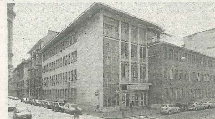
La probabile sede dell'Autorità dei trasporti a Torino